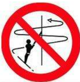
Не покидать трассу подъема