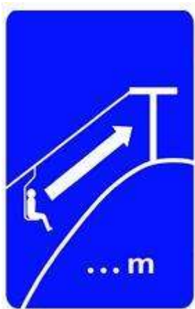
Прибытие через ... м