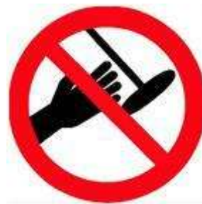
Не цепляться за бугель