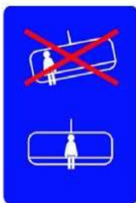
Не садиться на краю Сидеть в середине